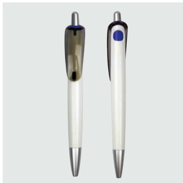
BOL 03 Bolígrafo Warhol