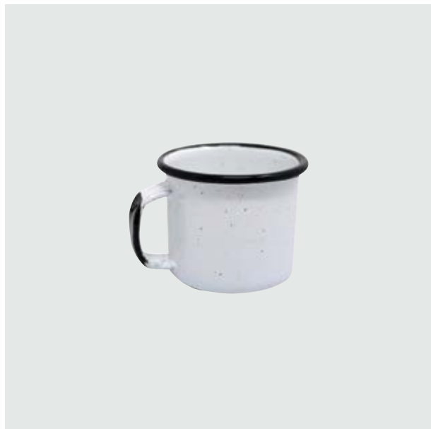
TH 212 Shot-Tequilero