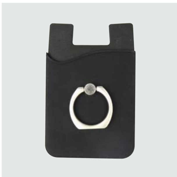
TEC 257 Mobile Tesla