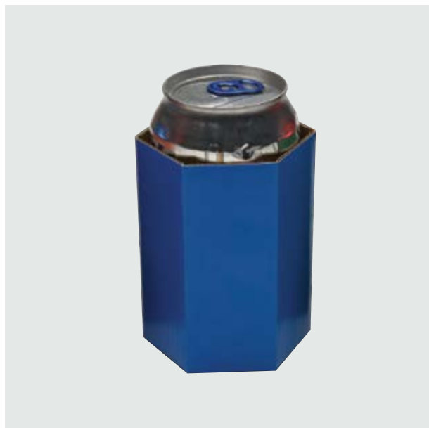
TH 306 Card Can-Holder